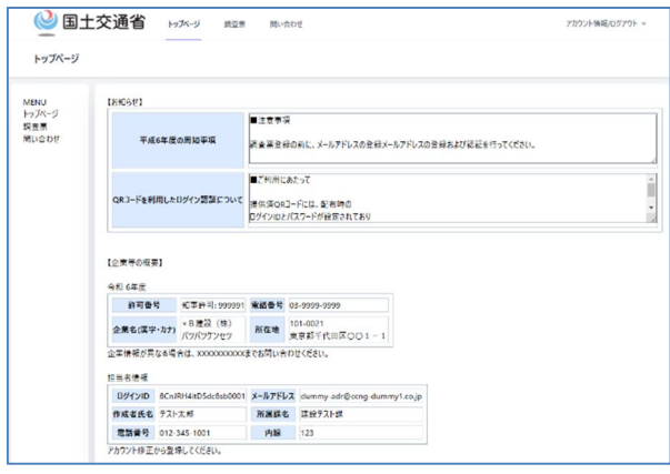
② ブラウザに URL を入力した場合