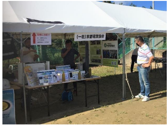
京都府総合防災訓練における防災啓発展示 出展状況