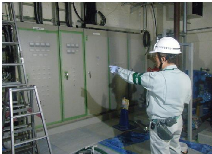
安全パトロール 実施風景