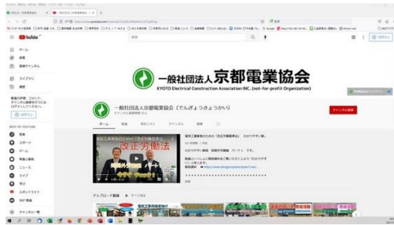
京都電業協会 Youtube チャンネル（令和2年8月開始）

最新の情報をタイムリーかつローコストで発信する情報提供として「ウェブサイト（ホームページ）」の充実に努めるとともに、Y o u t u b eでの動画配信、T w i t t e rを利用。