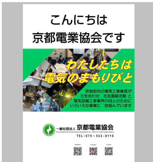
電気設備工事業界PR資料（令和3年作成）