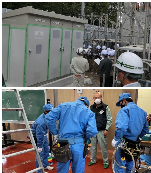
高校生対象・実技講習&建設現場見学会（令和4年実施）