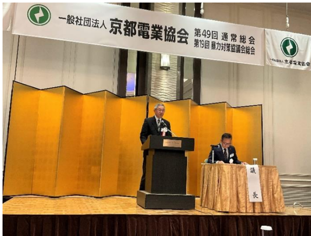
令和5年 第19回暴力対策協議会 総会