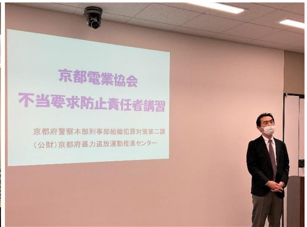
協会員向け 不当要求防止責任者講習