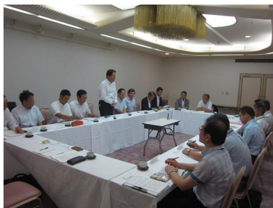
行政との意見交換会 光景