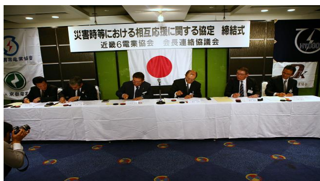
近畿6電業協会「災害時等における相互応援協定」締結式