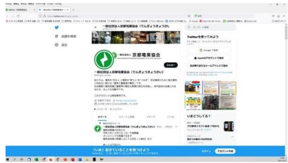
京都電業協会 Twitter（令和元年11月開始）